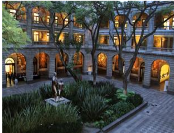
Edificio sede de la Secretaría de Educación Pública